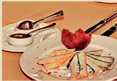
Ресторан Albatross: (057) 755 77 77

«Если представить, что «Мастерс» не был бы «мэйджором», вы все равно принимали бы в нем участие?» — спросили у игроков. 94 человека ответили «да». И только девять гольфистов в таком случае не приехали бы в Огасту.